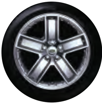
Pneus et jantes en alliage de 20 po

Ajoutez du style et de la fonctionnalité à l'une des parties les plus visibles de votre Range Rover sport. Les jantes en alliage et les écrous antivol accentuent la robustesse du véhicule.