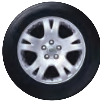
Jantes 9J x 19 po à 5 rayons en V, en alliage