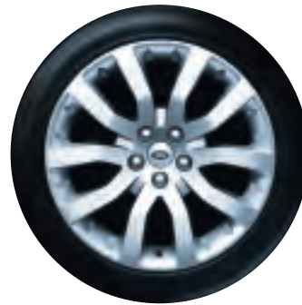
Jantes 9.5J x 20 po à 10 rayons, en alliage