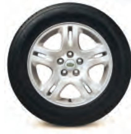
Jantes Style 3 de 18 po x 8J à 5 rayons divisés, en alliage (Pour modèles 2006 et ultérieurs)