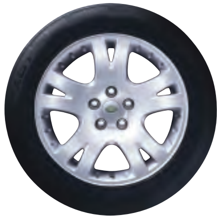
Jantes R3-Style de 19 po x 8J à 6 rayons, en alliage (Pour modèles 2003 à 2005 seulement)