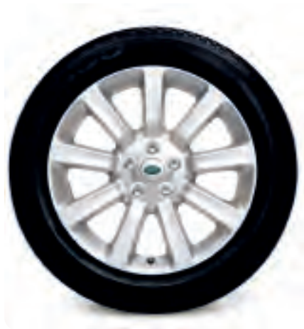
Jantes de 20 po à 9 rayons, en alliage Jantes seulement (Style 6) Dimensions des pneus : 255/50 R20 (jantes de série pour Range Rover à moteur suralimenté; pour modèles 2006 et ultérieurs)