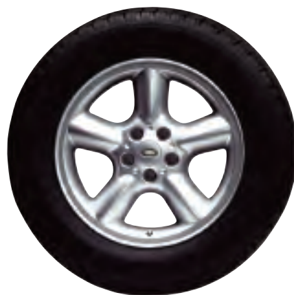
Jantes de 18 po à 5 rayons, en alliage (modèles de 2003 à 2005 seulement)

* Doivent être commandés en ensemble de cinq par véhicule. Pour les pneus Dunlop des roues motrices, il est recommandé d'utiliser une jante et un pneu côté trottoir pour la roue de secours.