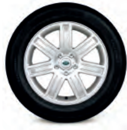
Jantes de 19 po à 7 rayons, en alliage Jantes seulement (Style 4) Dimensions des pneus : 255/50 R19 De série pour HSE (Pour modèles 2006 et ultérieurs)