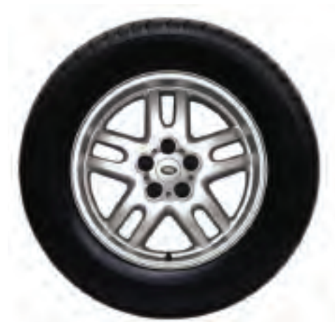
Jantes de 18 po à rayons jumelés, en alliage (Modèles 2003 à 2005 seulement)

(Pour modèles 2003 à 2005 seulement) RRJ100140MCM