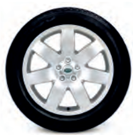
Jantes de 20 po à 7 rayons, en alliage et pneus* Dunlop ST8000 255/50 R20 109V tous terrains (Pour modèles antérieurs à 2006 seulement)

Jante et pneu côté gauche RRC502050MCM Jante et pneu côté droit RRC502040MCM